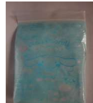
くすりがバラバラにならないように、ジップロック等の袋に入れて持参します。