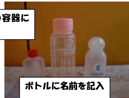
ボトルに名前を記入