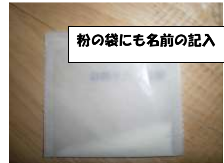
粉の袋にも名前の記入