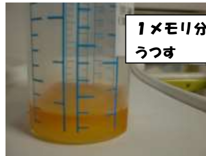
1メモリ分を別の容器にうつす →